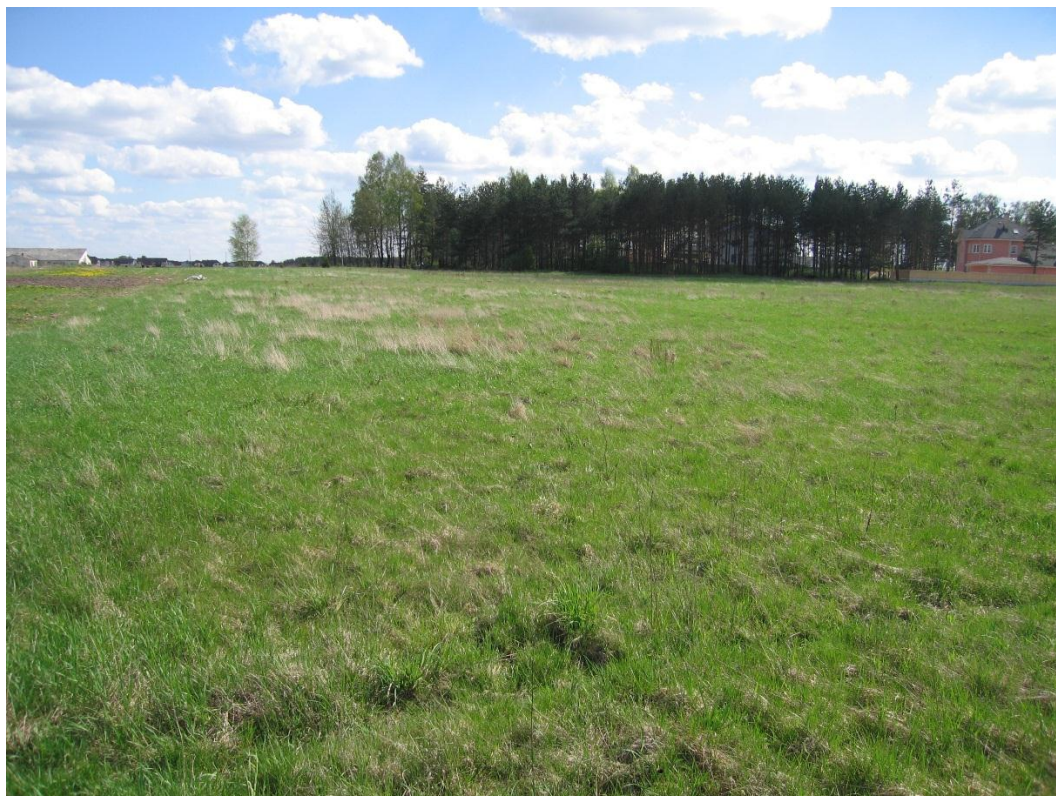
3. attēls. Skats uz detālplānojuma teritoriju no detālplānojuma īpašuma “Adiņas 2”

Detālplānojuma teritorija atrodas Ķekavas novada, Ķekavas pagasta Rāmavas ciemā, bez tiešas piekļuves no Ķekavas novada pašvaldības īpašumā esošas ielas.