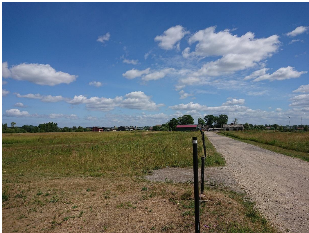
1.attēls. Skats uz detālpilanojuma teritoriju no vietējas nozīmes valsts autoceļa V2